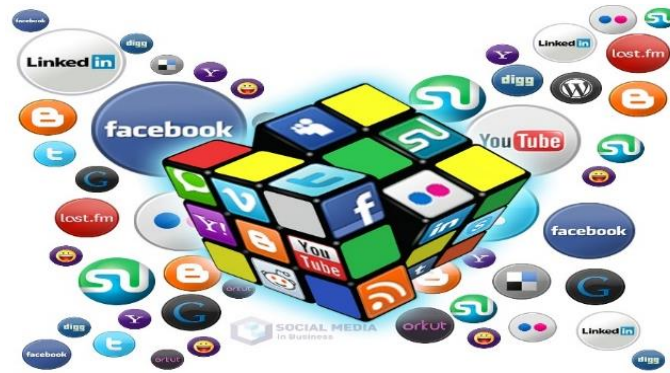
Figura 1: Social Meda