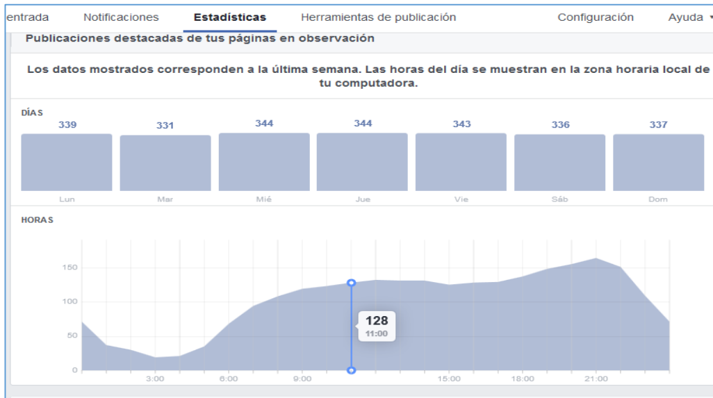
Figura 7: Estadística de Interacción con el público

Como se observa en la figura 6 el Canal de Comunicación y el cierre de negocios se realiza a través del Social media, esto ha creado un vínculo importante para la organización, los clientes buscan información sobre los trabajos realizados en la Consultora, adicional la información audio visual de testimonios y actividades representa el índice más importante en la toma de decisiones en el cierre de negocios. Se destaca en la presente figura la interacción con el público y se presentan los indicadores respectivos de acuerdo a horas y números de visitantes.