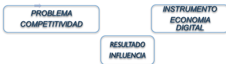
Figura 2. Variables a considerar para análisis de competitividad

En la actualidad las organizaciones, en un menor porcentaje de aprovechamiento y, las organizaciones globales consideran a la interpretación de los datos para la toma de decisiones “como una herramienta básica de la administración en todos los niveles” (Aguirre & Andrade, 2006), es por ello que las empresas hoy en día se encuentran en la continua búsqueda de conocimiento, siendo una alternativa a través de la utilización de la redes sociales y el impulso que le brindan al desarrollo de las organizaciones que las utilizan.