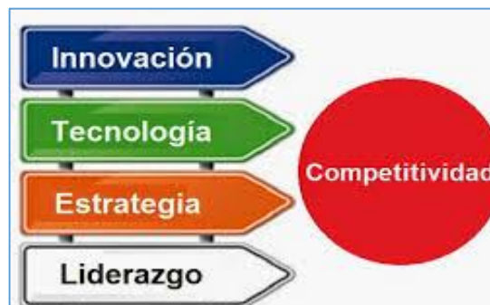
Figura 3. Variables del modelo Canvas en relación a competitividad.

Después de analizar la literatura, descripción y su aplicabilidad en la competitividad de los negocios, se elige el modelo Canvas, el cual se considera pertinente para analizar la variable competitividad a través del uso del social media en los negocios, siendo factores clave para medir esta relación la innovación, tecnología, estrategia y liderazgo, factores que a través de un eficaz uso del social media permitirán a las empresas alcanzar la competitividad tal como se muestra en la figura No. 3 a continuación.