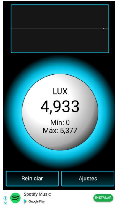
Figura 1: Medida del Chevrolet Optra en luces altas