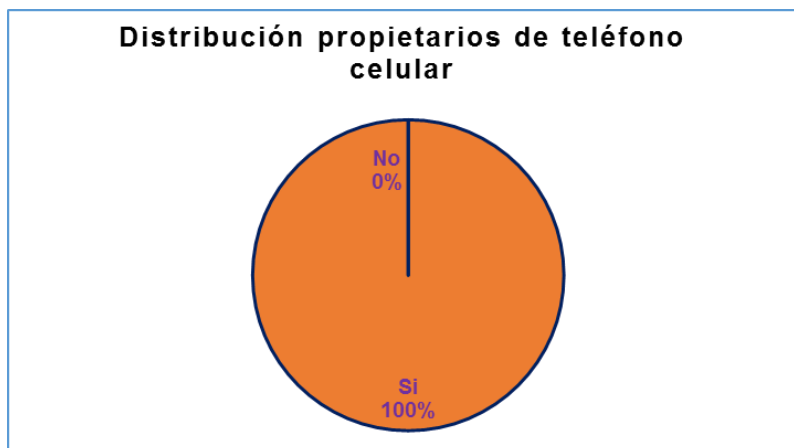
Figura 2: gráfico basado en la tabla No. 1, representa que el total de los encuestados poseen un teléfono móvil en Guayaquil, sector noreste.

Otro estudio de campo aplicado a 34 Distribuidores de combustible de la ciudad de Guayaquil, acerca de si conocen el sistema de dinero electrónico , el 74% de los encuestados desconocían del tema, por tanto no han tenido acceso a su uso, esto sería una dificultad al momento de implementar su uso, puesto que como comercio es indispensable que se encuentran actualizados con las reformas para poder atender a los clientes que quieran acceder al servicio que proporcionan usando el SDE como medio de pago. La información se puede observar en la tabla 2.