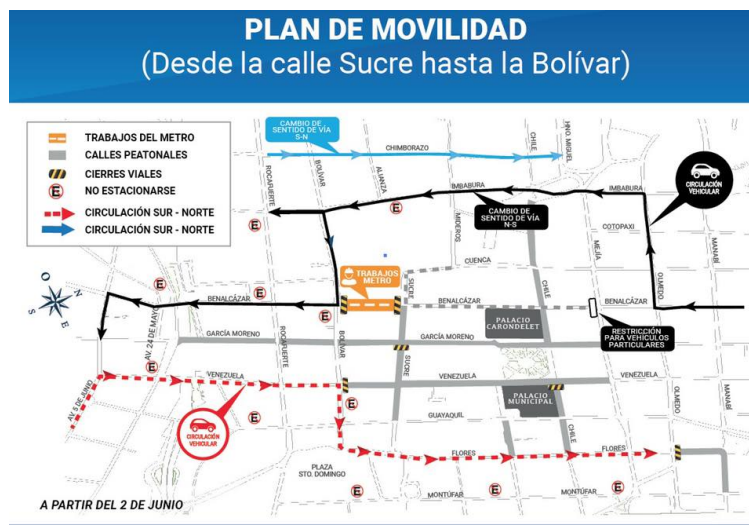
Ilustración #1 Se describe el plan de movilidad para el Centro Histórico de Quito, a propósito de un cierre vial por la construcción del Metro de Quito. En la imagen se muestran con un color gris las calles peatonizadas del sector.

la calle García Moreno (107.120,00 dólares), buscando “que el paseo peatonal luzca atractivo para los visitantes del casco colonial”, materializando la ideología, estética y actores patrimoniales que pueden hacer uso del espacio.